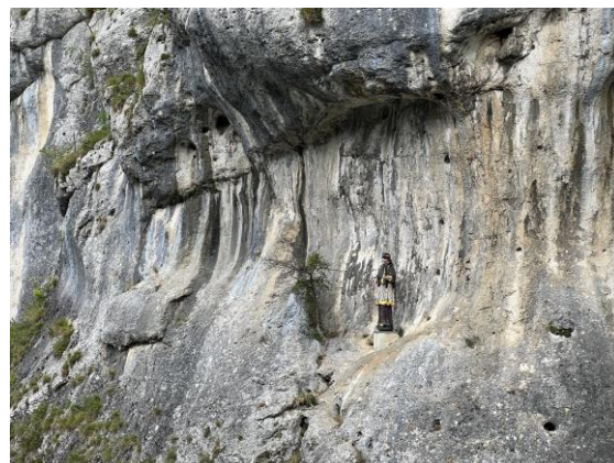
Ergebnis gewaltiger erdgeschichtlicher Entwicklung

2022 hat Ereignisse mit sich gebracht, die die meisten Menschen bei uns für längst überwunden, für nicht mehr zu erwarten, angenommen haben: